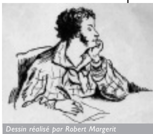
Dessin réalisé par Robert Margerit